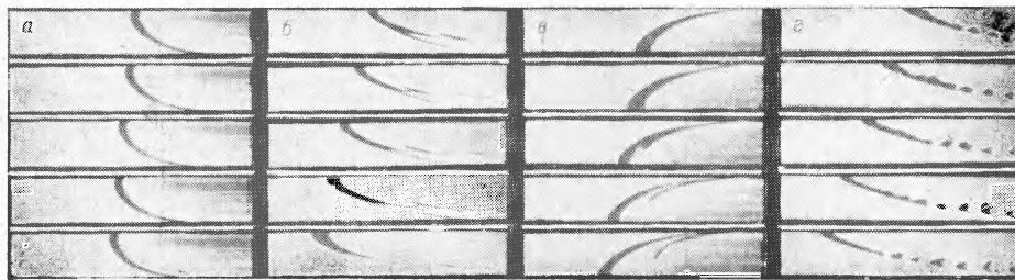
Рис. 1. Теплогограммы фронта пламени, полученные при вертикальном положении ножа.

В качестве источников высокого напряжения использовались аппарат для испытания пробоя кабелей АКИ-50 (источник высокого напряжения отрицательной полярности) и высоковольтный выпрямитель «Тесла» (источник высокого напряжения положительной полярности). Максимальная величина напряженности поперечного электрического поля составляла 18,6 кВ/см.