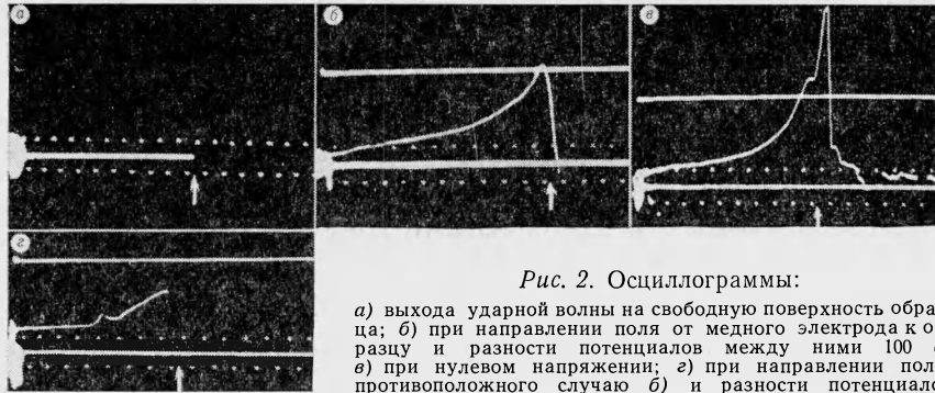
Рис. 2. Осциллограммы:

а) выхода ударной волны на свободную поверхность образца; б) при направлении поля от медного электрода к образцу и разности потенциалов между ними 100 в; в) при нулевом напряжении; г) при направлении поля, противоположного случаю б) и разности потенциалов 400 в.