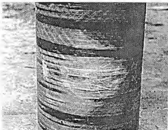
Рис. 3. Вид разрушенного образца 8 (см. таблицу) после 15-го нагружения

ностные и деформационные характеристики которого ниже, чем у стеклянных волокон, образуются области засветлений [5, 12]; далее отслаиваются и разрушаются отдельные нити из волокон, затем повреждаются отдельные слои, и в конечном итоге образуется сквозная трещина с рыхлыми краями (рис. 3). Близость характера разрушения оболочек из стеклопластика при однократном и многократном нагружениях указывает на то, что возникающие в композите повреждения слабо зависят от скорости деформации и даже, по-видимому, от уровня нагружения. Но кинетика их накопления и достижения критического (разрушающего) уровня поврежденности существенно зависит от этих факторов, а также от длительности фаз нагрузки — разгрузки.