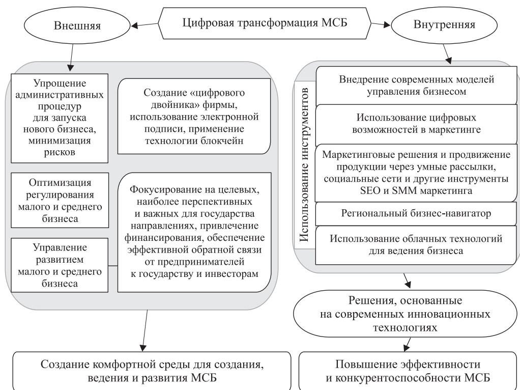
Рис. 3. Направления цифровой трансформации малого и среднего бизнеса

степень вовлеченности субъектов рассматриваемой области предпринимательства в цифровую экономику. Так, в сборнике «Индикаторы цифровой экономики 2019» [1] прямо указано, что основные показатели рассчитаны без учета субъектов малого бизнеса.