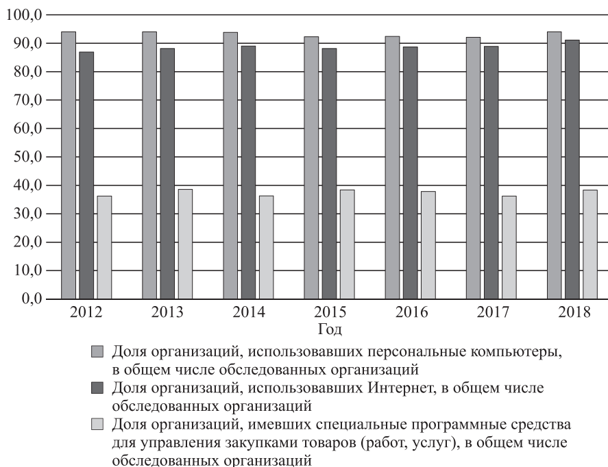
Рис. 1. Долевые характеристики предприятий по использованию информационных средств и сети Интернет за 2012–2018 гг.

2017 г. почти 65 % компаний среднего и малого бизнеса в России осознавали необходимость цифровой трансформации. Однако данный процесс связан с целым рядом проблем и вопросов, которые были сгруппированы нами и представлены в таблице.