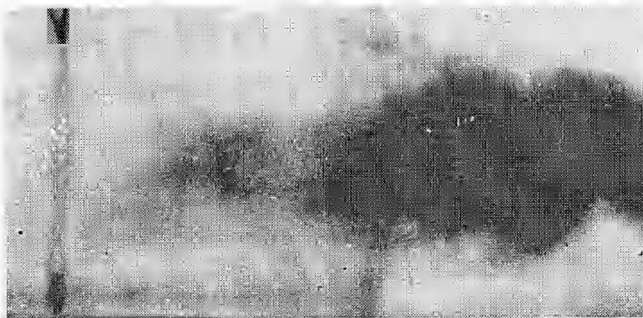
Рис. 1. Поток частиц от осесимметричного кумулятивного заряда с облицовкой из порошкового вольфрама

сжатии пористого вещества, начиная с определенной величины пористости, столь велики, что выделяющегося тепла оказывается достаточно для значительного нагрева и последующего разуплотнения вещества [3]. Следовательно, если величина пористости материала кумулятивной облицовки удовлетворяет условию (1), то вместо компактной кумулятивной струи образуется облакоподобный поток частиц. Типичный вид такого потока иллюстрирует рис. 1, где представлена рентгеноимпульсная фотография работы осесимметричного кумулятивного заряда с облицовкой из порошкового вольфрама насыпной плотности спустя 103 мкс от момента инициирования заряда. Средняя скорость частиц вольфрама в этом опыте составляла 2 \div 2,5 км/с. Заметим, что для такого материала, как вольфрам, подобная скорость частиц недостижима при других способах нанесения покрытий.