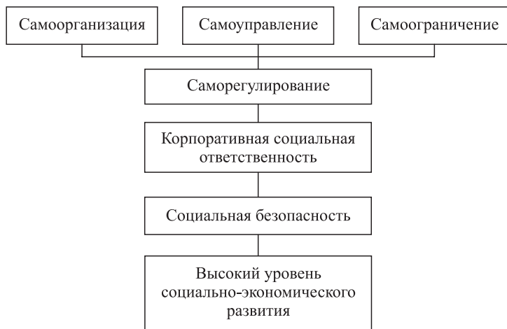
Рис. 3. Концепция развития общества

Лучшим способом разрешения любых конфликтов, несомненно, является их предотвращение. Однако, если это абсолютно невозможно, то нужно хотя бы уменьшить их вероятность. Для реализации этой цели можно предложить концепцию развития всех субъектов, которая основывается на принципах самоорганизации, самоуправления и самоограничения (рис. 3).