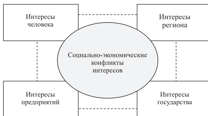
Рис. 1. Конфликты в социально-экономической среде

Из определения конфликта ясно, что одним из важных его признаков является противоположность интересов. Именно интересы [5] являются реальной причиной деятельности социальных субъектов, направленной на удовлетворение определенных потребностей; лежат в основе непосред-