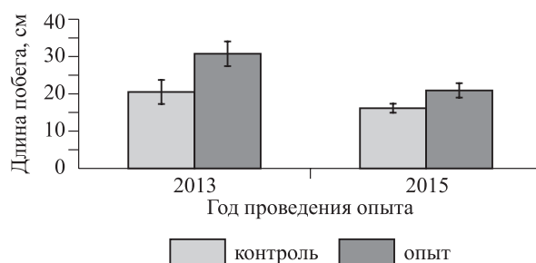
Рис. 1. Длина побегов карликовой яблони после экзогенного нанесения GA3.