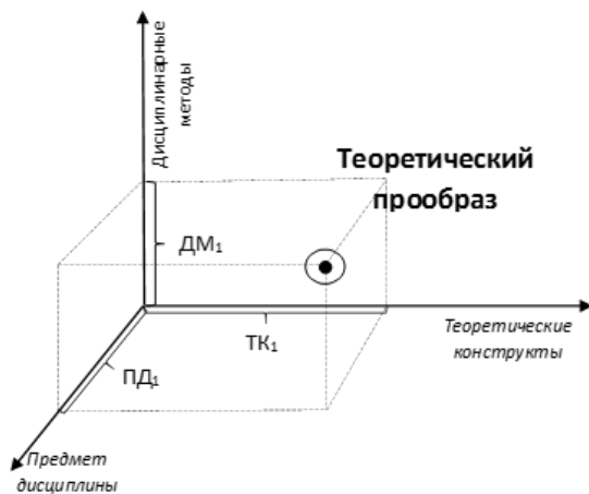
Рис. 1. Трехмерное дисциплинарное пространство конструирования теоретических прообразов феномена образования

Таким образом, в контексте нашей работы под дисциплинарным теоретическим прообразом феномена образования понимается произвольный теоретический идеализированный объект феномена образования, сконструированный в дисциплинарном пространстве с опорой на плоскости «предмет дисциплины», «дисциплинарные методы», «теоретические конструкты» и заданный архитектурными координатами (ПД, ДМ, ТК) данного пространства. Визуально трехмерное дисциплинарное пространство конструирования теоретического прообраза феномена образования может быть представлено в виде системы архитектурных координат (рис. 1). Продуктивность обращения к графическим средствам визуального представления теоретического знания, в частности при познании социальных феноменов, раскрыта нами ранее [19].