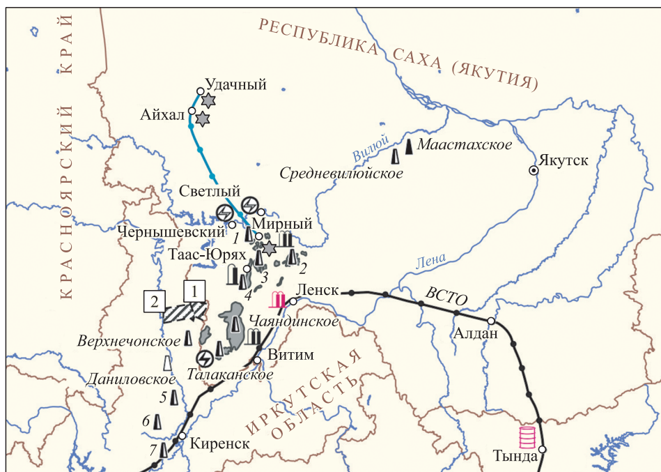
Месторождения ▲ Нефти ▲ Газа ▲ Нефти и газа ▨ Нефтегазоносные участки ☆ Алмазов ● Редких металлов —●— Нефтепроводы Цифрами обозначены месторождения: 1 Северо-Неблинское 2 Верхневилочанское 3 Таас-Юряхское 4 Среднеботуобинское 5 Дулисминское 6 Ярактинское 7 Марковское