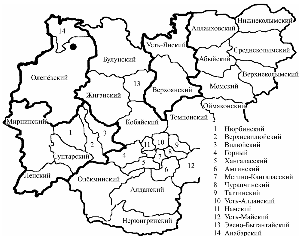
Рис. 1. Наиболее значимые территориальные сочетания минеральных ресурсов Республики Саха (Якутия) в границах административных районов (без учета Алданского и Нерюнгринского).

убедительны. Сумма присваиваемых баллов различается в зависимости от размеров и уникальности запасов (федерального, республиканского или местного значения), степени их изученности и, что важно отметить, с учетом коэффициента доступности. Первые места также принадлежат районам, которые формируют ареал территориального сочетания минеральных ресурсов Западной Якутии.