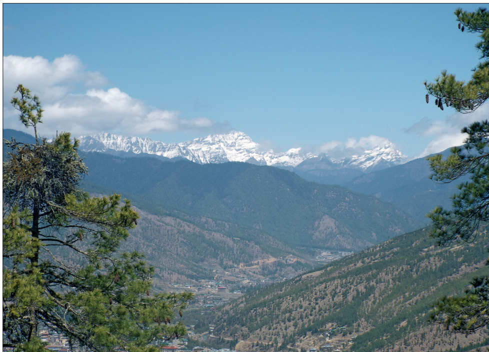
Рис. 2. Хвойные сосновые леса в горной котловине Тхимпху. Март 2015 г.