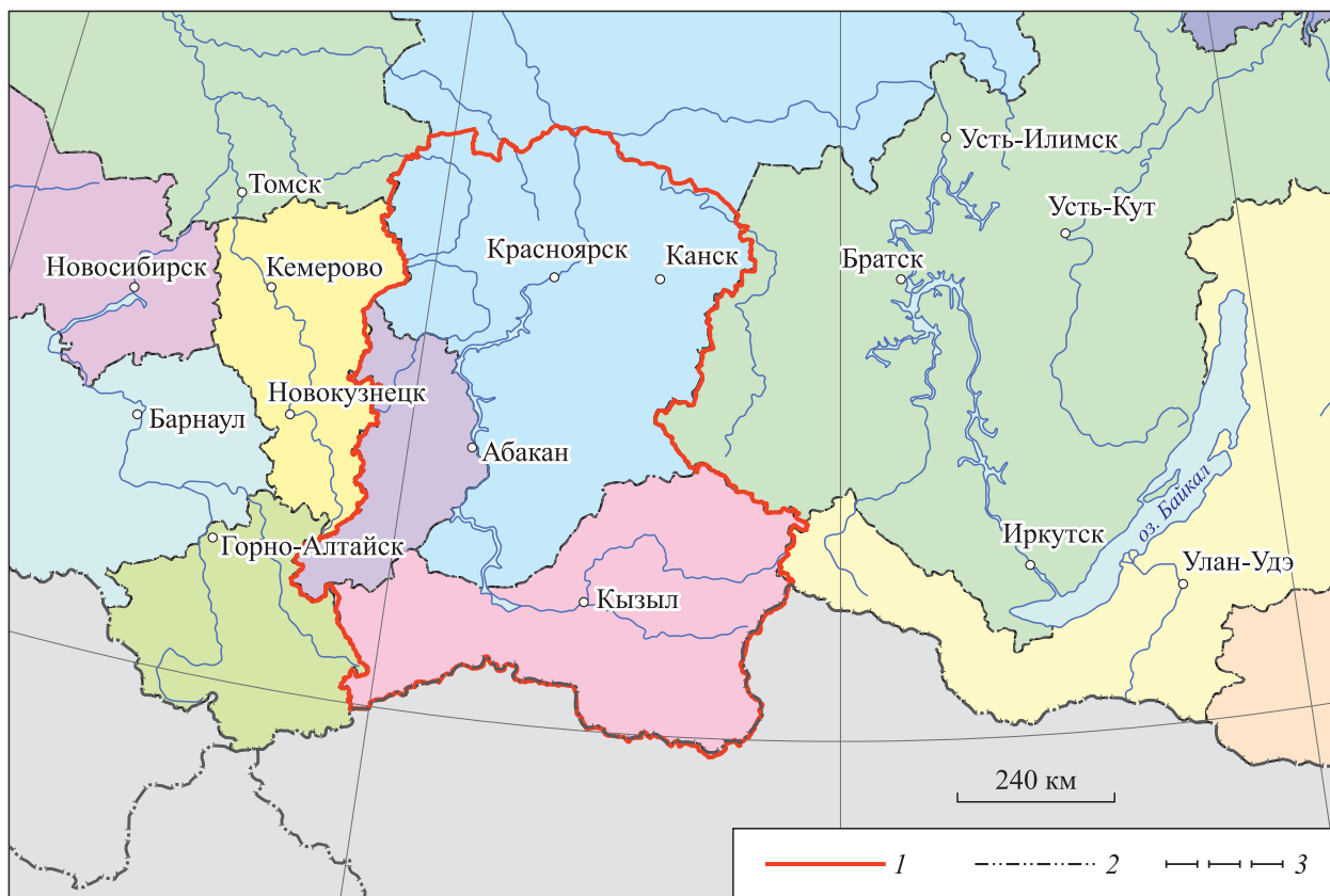
Рис. 1. Территория планируемого комплексного инвестиционного проекта «Енисейская Сибирь».

Границы: 1 — территории исследования, 2 — субъектов РФ, 3 — государственная.