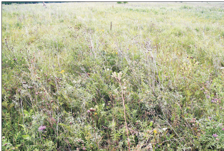
Рис. 3. Старый отвал с ПСП. Луговой (травянистый) тип сукцессии.