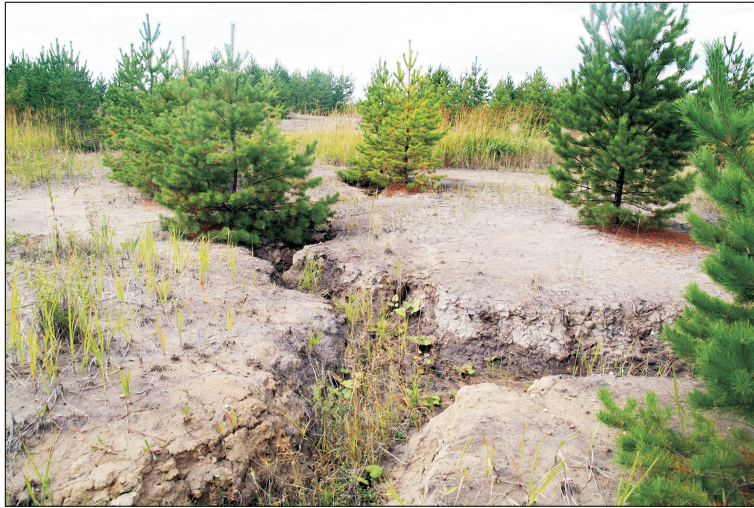
Рис. 2. Мелкоовражная эрозия на отвалах без ПСП, спровоцированная механической посадкой сосны в борозды вдоль склона.