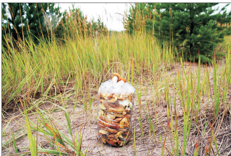
Рис. 4. Урожай шляпочных грибов, собранных в течение 15 мин на отвалах после лесной рекультивации (создания культур сосны).