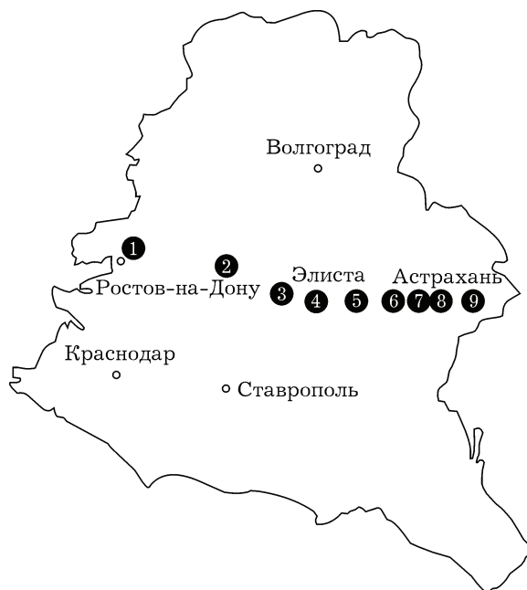
Рис. 1. Картограмма исследуемых участков: 1 – Персиановский; 2 – Зимовники; 3 – Ремонтное; 4 – Элиста; 5 – Яшкуль; 6 – Хулхута; 7 – Барханы; 8 – Линейное; 9 – Астрахань

Для изучения морфологии почв и отбора почвенных образцов в августе 2009 г. закладывались полнопрофильные разрезы и прикопки к ним на типичных по рельефу и растительности ключевых участках. Названия почв даны по классической классификации [Классификация..., 1977; Вальков и др., 2008б].