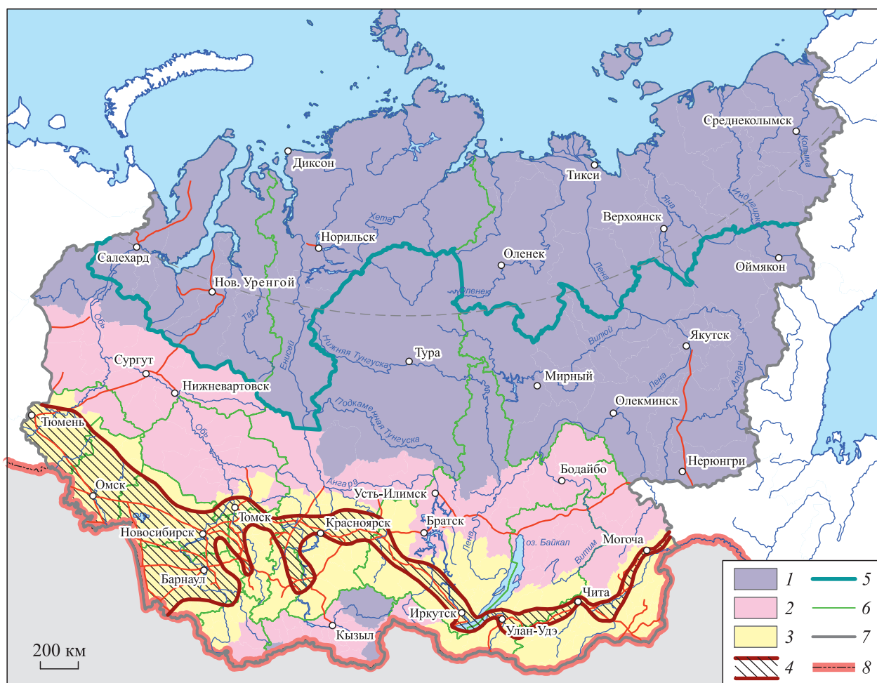
Рис. 1. Широтное зонирование Сибири (по состоянию на 1 августа 2019 г.).

К зоне Дальнего Севера принадлежат огромные малообжитые пространства к северу от зоны Ближнего Севера, а также наиболее труднодоступные горные районы на юге. Эта зона занимает подавляющую часть площади Сибири — 61,6 %, где проживает лишь 7,6 % ее населения. Районы Даль-