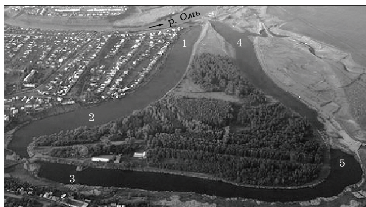
Рис. 1. Аэрокосмический снимок оз. Калач с указанием станций отбора проб

Криофитон оз. Калач изучали зимой 2010–2011 и 2011–2012 гг. Пробы льда отбирали один раз в месяц на пяти станциях, расположенных равномерно по акватории озера (см. рис. 1), одновременно на этих же станциях отбирали подледный фитопланктон. С помощью ледобура из средней части льда вырезали образцы толщиной в 10–15 см. После таяния льда при комнатной температуре пробы фиксировали формалином, измеряли объем полученной воды и концентрировали осадочным способом. Обработка проб криофитона и фитопланктона велась по общепринятым в гидробиологии методам [Федоров, 1979]. Доминирование видов определяли по их численности, включая в состав доминантов виды,