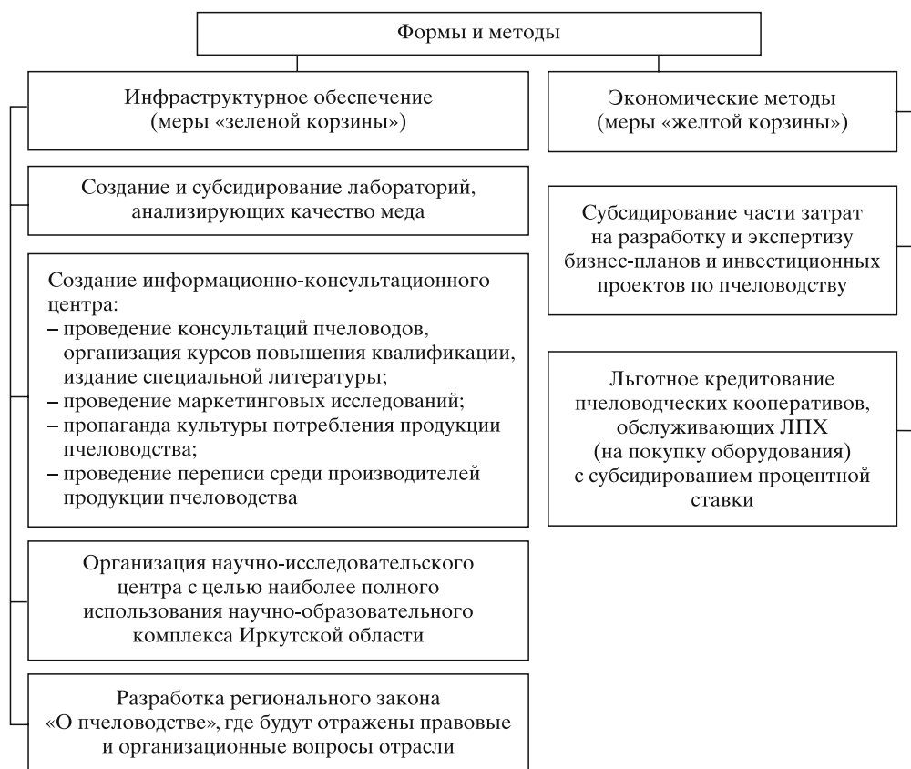
Рис. 2. Меры государственного воздействия на рынок продукции пчеловодства на региональном уровне

По нашему мнению для развития рынка продукции пчеловодства в регионе в условиях вступления России во Всемирную торговую организацию система мер государственного воздействия со стороны региональных органов власти должна выглядеть, как представлено на рис. 2.