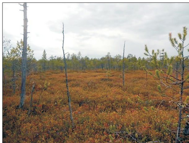
Рис. 2. Сухостой сосны на болоте.

свидетельствует сухостой сосны с пожарными подсушинами (рис. 2).