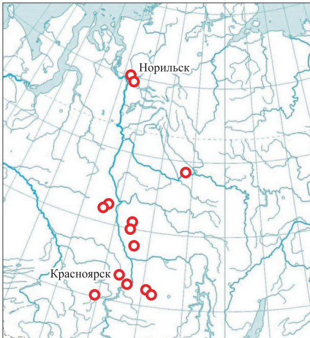
Рис. 1. Схема расположения ключевых участков с обследованными почвенными разрезами, включенными в БД «Тепловые портреты почв».

По материалам радиометрической съемки авторским методом (Пономарева, Пономарев, 2018) сформирован банк данных температурных полей почвенных профилей, представленных в формате двухмерных (2-D) массивов значений температур с пространственным разрешением 1 × 1 см. Тепловой портрет почвенного профиля построен как схематическое изображение температурных полей вертикальной стенки почвенного разреза в виде диаграммы Excel.