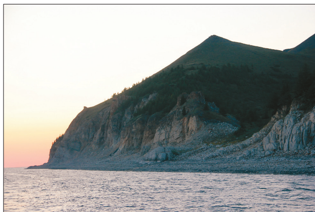
Рис. 3. То же по состоянию на 2014 г.

По нашим наблюдениям, на рубеже рек Чинке и Соболя-Юряге находится современная граница распространения лиственничных сообществ, удаленных от береговой линии р. Лены. Если в бассейне р. Чинке фрагменты лиственничников встречаются нередко, то в бассейне р. Соболя-Юряге (устье реки находится ~ 1 км севернее р. Чинке) лиственничники нами вообще не обнаружены, тогда как по береговым обрывам р. Лены лиственница Каяндера, в том числе ее древовидные формы, еще встречаются и ниже устья р. Соболя-Юряге, что говорит о приоритетной тенденции продвижения дре-