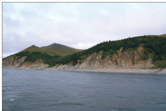
Рис. 4. То же в 2012 г..