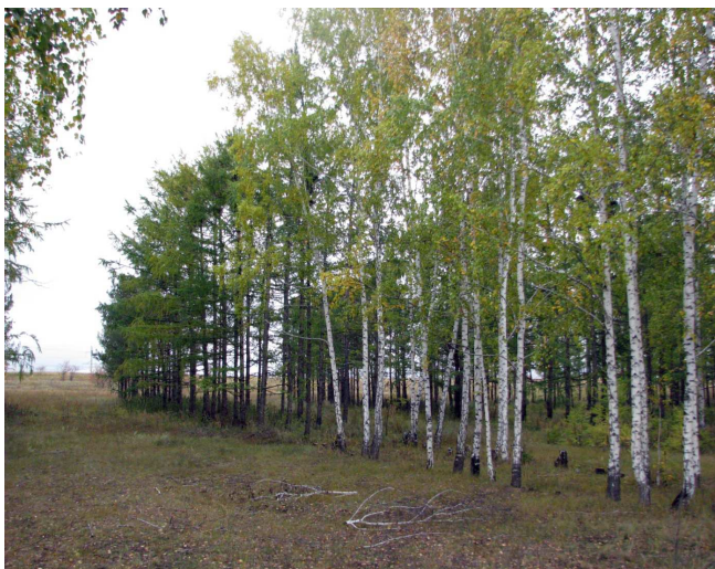
Рис. 1. Смешанная защитная лесополоса из березы повислой и лиственницы сибирской (Ширинский р-н, Республика Хакасия).