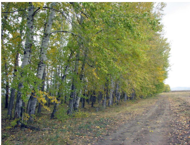
Рис. 3. Чистая по составу полезащитная лесополоса из тополя черного (окрестности пос. Соленоозерный, Ширинский р-н, Республика Хакасия).

Перечет деревьев в большинстве случаев выполнялся по двухсантиметровым ступеням. По числу деревьев ряды распределения соответствовали принципу достаточности (Вайс и др., 2005), т. е. превышали 200 наблюдений (вариант). Построение диаграмм выполнялось в электронной таблице «Excel». В дальнейшем был выполнен визуальный анализ рядов распределений на оценку устойчивости насаждений и выявление оптимальных агротехнических параметров защитных лесополос.