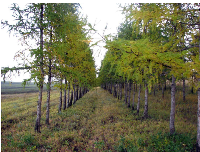
Рис. 2. Чистая по составу полезащитная лесополоса из лиственницы сибирской (окрестности пос. Соленоозерный, Ширинский р-н, Республика Хакасия).