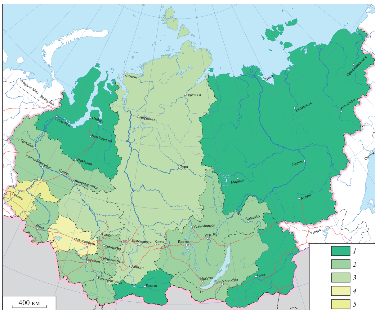
Рис. 2. Коэффициент миграционного прироста/убыли населения в регионах Сибири в расчете на 1000 чел.: 1 — более 10 (сильный приток населения, более чем в 5 раз выше среднероссийского уровня); 2 — 5–10 (приток населения, превышающий среднероссийский уровень); 3 — приток населения, близкий к среднероссийскому уровню; 4 — –5–0 (отток населения); 5 — менее –5 (сильный отток населения).

Постсоветская миграция носит преимущественно внутрирегиональный характер: на внутрирегиональные перемещения приходится 60 % миграции. Среди сибирских регионов выделяются два «полюса»: полюс «замкнутости» — Республика Тыва, где свыше 80 % миграций осуществляется в преде-