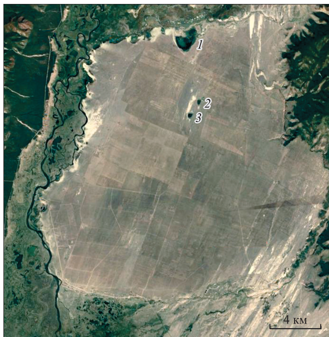
Рис. 1. Космоснимок Нижнего куйтуна, расположенного в Баргузинской впадине.

В средней части Баргузинской впадины (Бурятия) находятся три содовых озера, вызывающих интерес у нескольких поколений исследователей. Эти водоемы связаны с песчаным образованием,