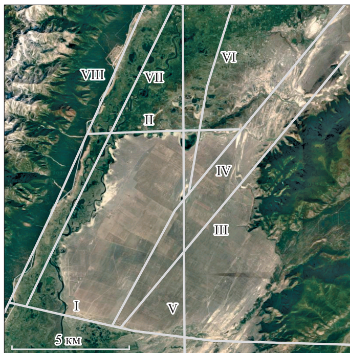
Рис. 2. Система разрывных нарушений, проходящих через Нижний куйтун.