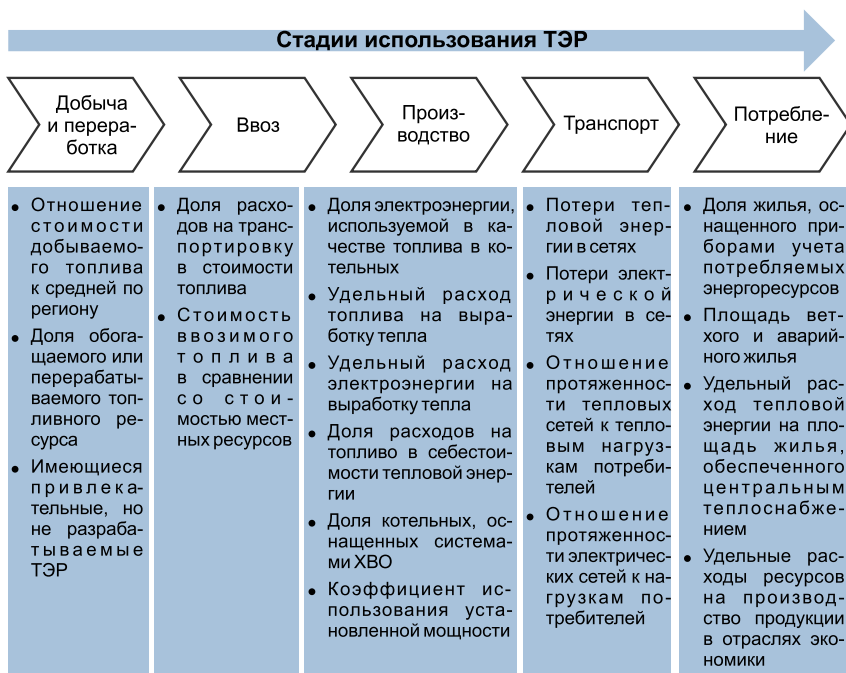
Рис. 1. Индикаторы энергоэффективности использования топливно-энергетических ресурсов на уровне муниципального образования

повлияют на них эти изменения. Одним из ключевых факторов в этом случае становится энергетическая безопасность – состояние защищенности территории от угрозы дефицита в обеспечении обоснованных потребностей в энергии экономически доступными ТЭР приемлемого качества в нормальных условиях и при чрезвычайных обстоятельствах, а также от угрозы нарушения стабильности топливно-энергоснабжения. Защищенность – это состояние, соответствующее в нормальных условиях обеспечению обоснованных потребностей в энергии в полном объеме, а в экстремальных условиях – гарантированному обеспечению минимально необходимого объема потребностей. В обоих случаях должны соблюдаться установленные требования в отношении экологического воздействия и безопасности функционирования объектов энергетики и экономики в целом.