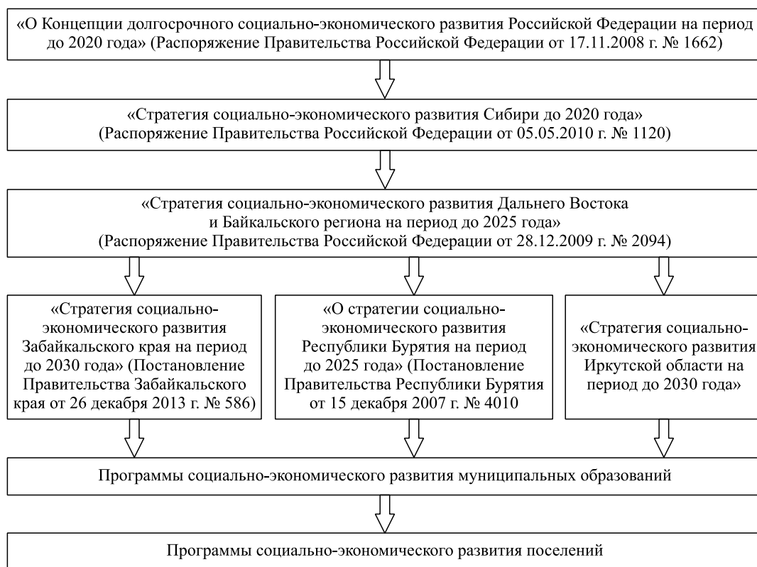
Рис. 1. Система стратегического планирования социально-экономического развития территорий.

реализации региональной политики по основным стратегическим направлениям развития человеческого потенциала выделены следующие группы МО Байкальского региона (рис. 2).