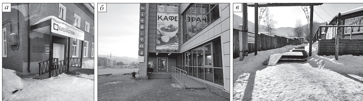
Рис. 2. Объекты туристской инфраструктуры в Слюдянском районе с элементами доступной среды.

Полевые исследования в Слюдянском районе Иркутской области показали, что территории не в полной мере адаптированы к требованиям по созданию доступной среды. Требования для организации данного вида отдыха установлены государственным стандартом [17]. На рис. 2 представлены примеры объектов, которые приспособлены принимать особенных туристов в Слюдянском районе. Полевые наблюдения показали, что Байкальск лидирует в организации доступного пространства для людей с ОВЗ. В городе есть объекты, которые способны принимать маломобильных граждан (музеи, средства