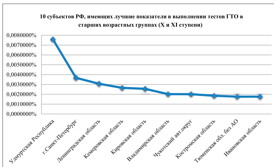
Рис. 2. 10 субъектов РФ, имеющих лучшие показатели в комплексе ГТО X и XI ступени